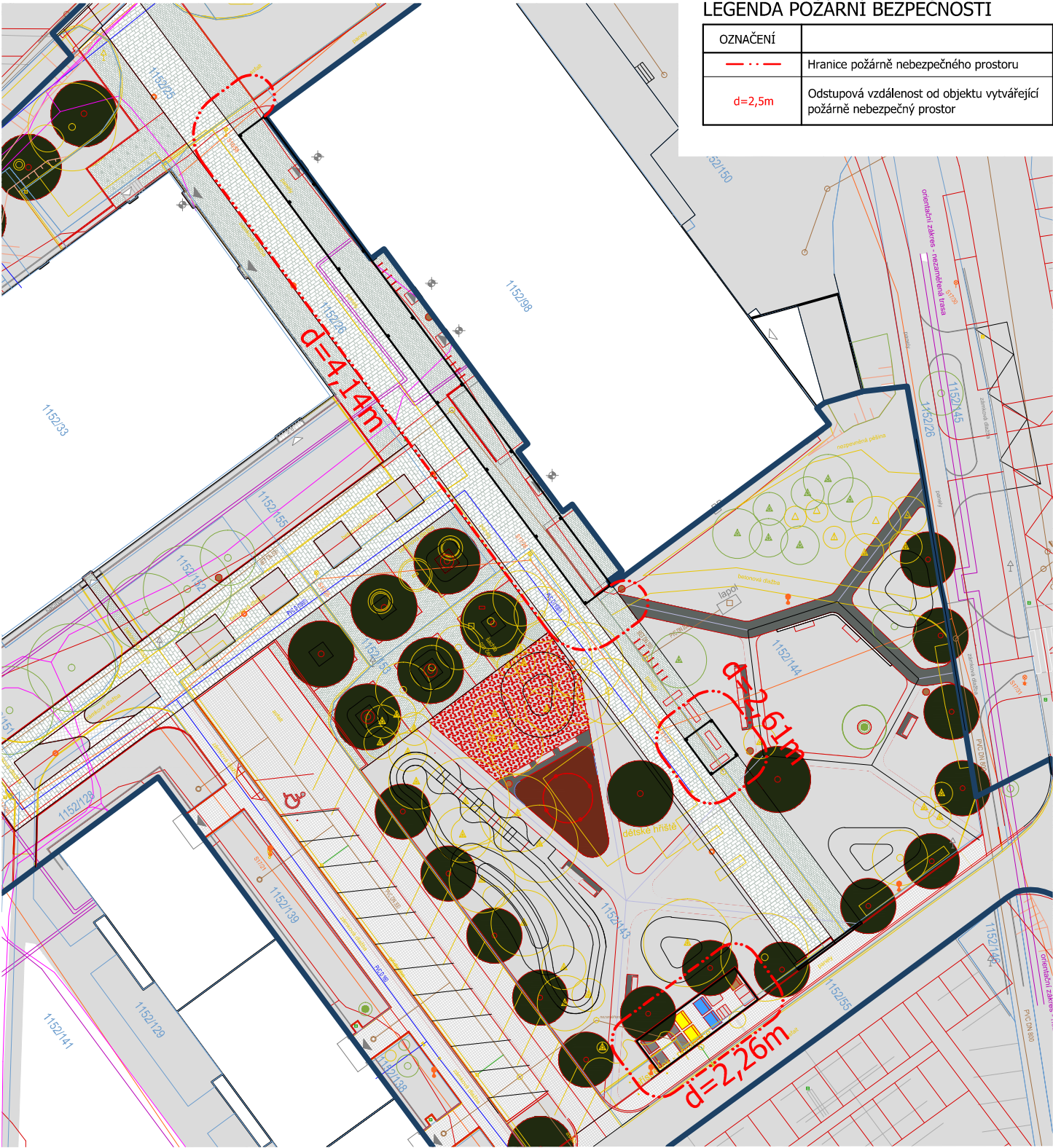
LEGENDA POŽÁRNÍ BEZPEČNOSTI